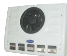
Максимальный объем до 10 м 3

Габаритные размеры: 603x548x172 мм Вес: 15 кг Расход воздуха: 650 м 3 /час